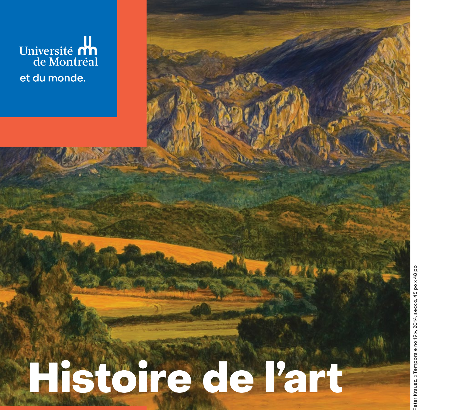
Peter Krausz, « Temporale no 19 », 2014, secco, 45 po x 48 po